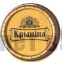
BY-Минск (Крыница) A/R