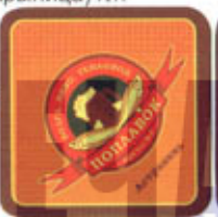
RUS-Астрахань (Поплавков) A/R