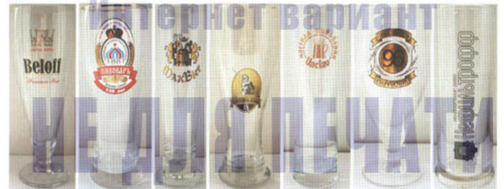
RUS-Кузнецк - Волгоград - СПб (Maximilian Brauhaus) - СПб (Blonder Beer) - Пермь (Vaclav) - Екатеринбург (96) - Томск

ПИВНЫЕ БАНКИ - BEER CANS - BIERDOSEN - BOITES A BIERE - LATTINE DI BIRRA - PLECHOVKY