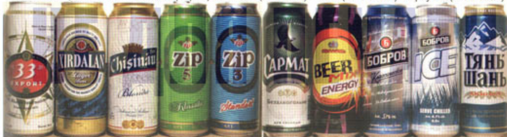
AZ-Баку x2 / MD-Кишинев / TMN-Ашхабад x2 / UA-Донец - Киев (Оболонь) / BY-Бобруйск x2 / KZ-Алма-Ата (Динал)