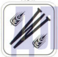
RUS-Ижевск (Welten) 1