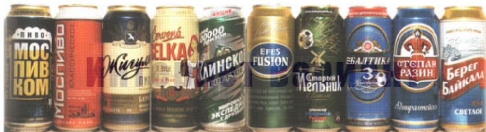
RUS-Мытищи x4 - Клин - Москва (Эфес) x2 - СПб (Балтика) - СПб (Ст. Разин) - Иркутск (Хайнекен)