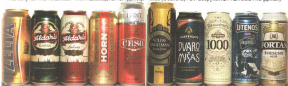
LV-Рига (Aldaris) x3 / LT-Каунас (Ragutis) / LV-Цесис / LT-Каунас (Ragutis) - Шауляй - Клайпеда - Утена - Каунас (Ragutis)

ПИВНЫЕ БАНКИ - BEER CANS - BIERDOSEN - BOITES A BIERE - LATTINE DI BIRRA - PLECHOVKY