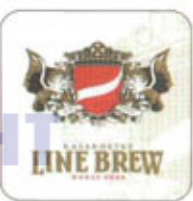
KZ-Карасайский рн 1